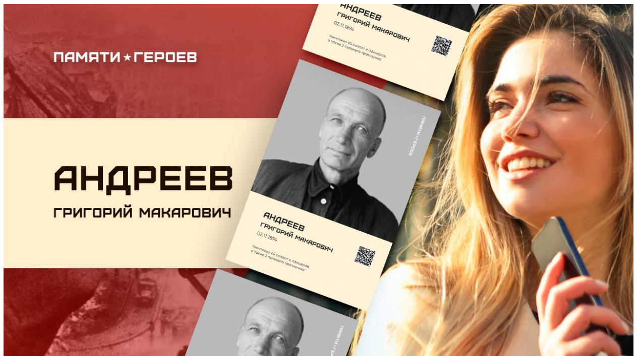
Рис. 3. Образец превью на загружаемый ролик о Герое. Шаблон .psd во вложении.