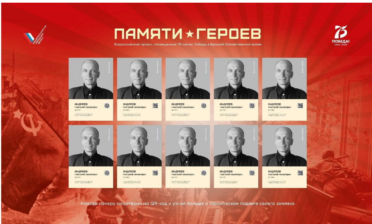
Рис. 5. Тематический стенд, на котором ежемесячно обновляется информация о героях